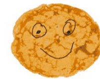
C'est l'heure de la chandeleur !

L'APEL de l'école du Sacré Cœur de Plounéour-Brignogan-Plages, vous remercie pour le bon accueil que vous avez réservé aux enfants de l'école lors de la vente de crêpes. Nous remercions vivement tous les bénévoles, amis de l'école, le gang des lavoirs et Beva Er Vro qui ont contribué au bon déroulement et à la réussite de l'opération "crêpes " avec 540 douzaines soit 6480 crêpes confectionnées !!!